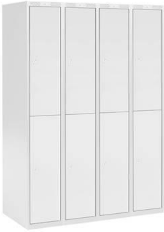
Veids Nr. 4